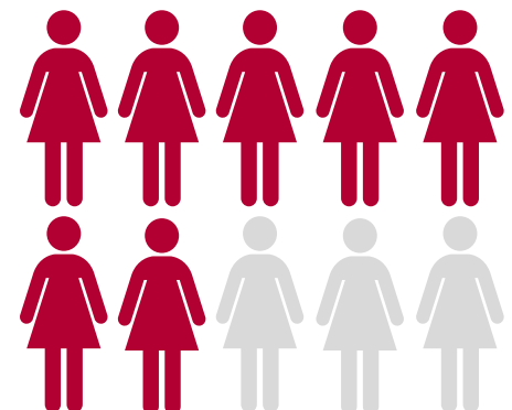
En 2016, en California, 71% de las mujeres hispanas entre 10 y 24 años víctimas de homicidio fue asesinado con disparos de armas de fuego.