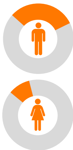
Porcentajes de víctimas hispanas de suicidio con armas de fuego en California en anaranjado y de víctimas de suicidio sin uso de armas de fuego en gris.