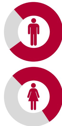
Porcentajes de víctimas hispanas de homicidio con armas de fuego en California en rojo y de víctimas de homicidio sin uso de armas de fuego en gris.